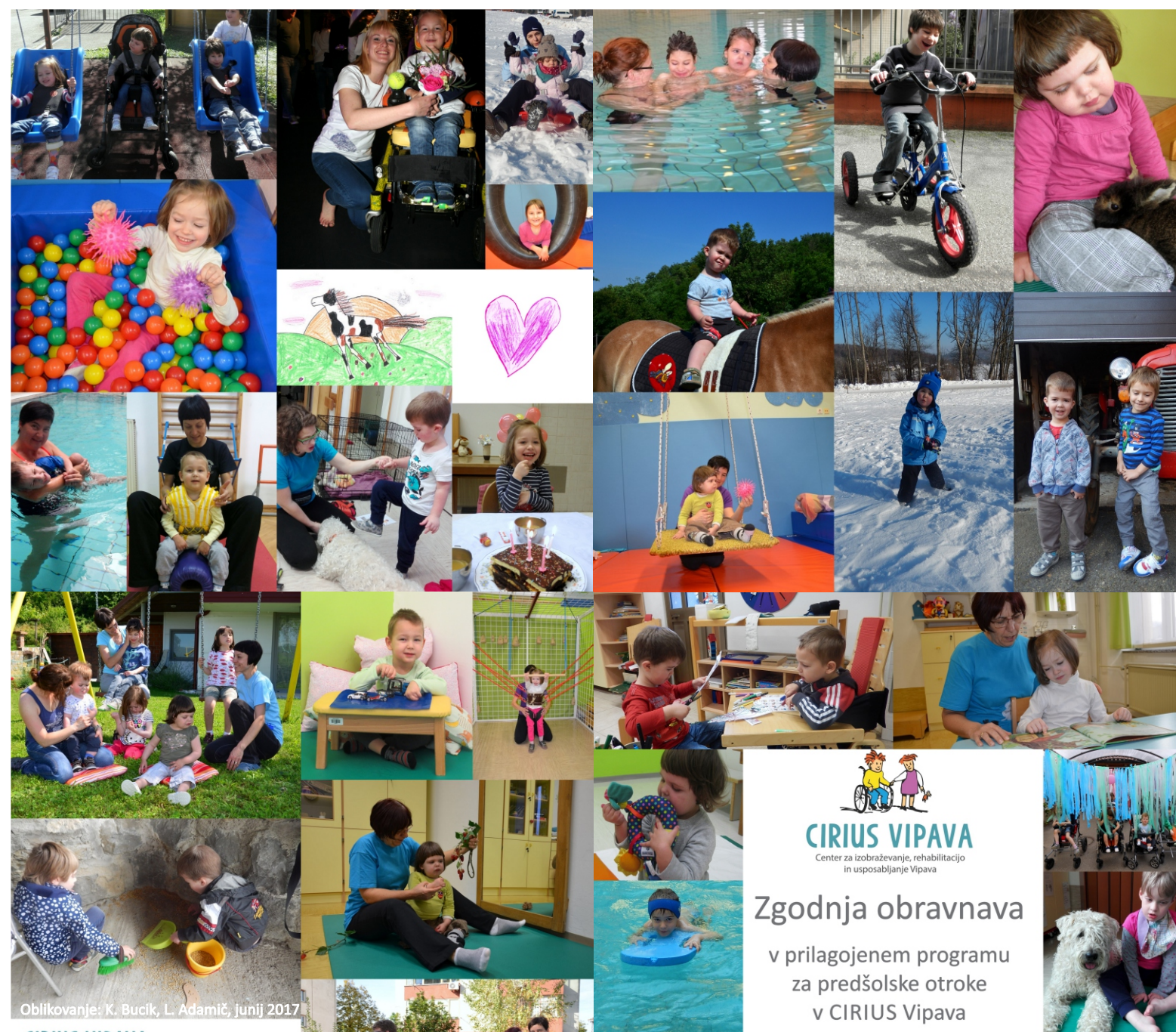
Oblikovanje: K. Bucik, L. Adamič, junij 2017